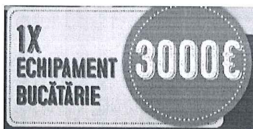
Voucher Echipament bucatarie – ProCucina